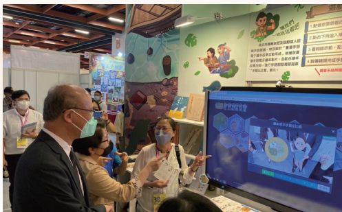
介紹本館手語系統