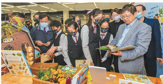
慢讀好食刻巡迴全臺竹縣圖首站開跑縣長支持

積極與閱讀文化基金會合作，於本縣各國中小設置愛的書箱，改善閱讀環境及充實館藏，目前全縣每生擁書冊數已達39.13冊，110年更榮獲教育部閱讀磐石獎10項獎項肯定；109年底獲宏致集團及維成牙醫捐贈「新竹縣首輛行動書車」，自110年3月起巡迴全縣文化節點及校園，有效行銷公共圖書館服務並提升在地閱讀風氣，因成效頗豐，至111年及112年再獲贈兩輛行動書車分別予本縣尖石鄉及竹東鎮，將圖書資源送進偏鄉，打造閱讀共好環境。