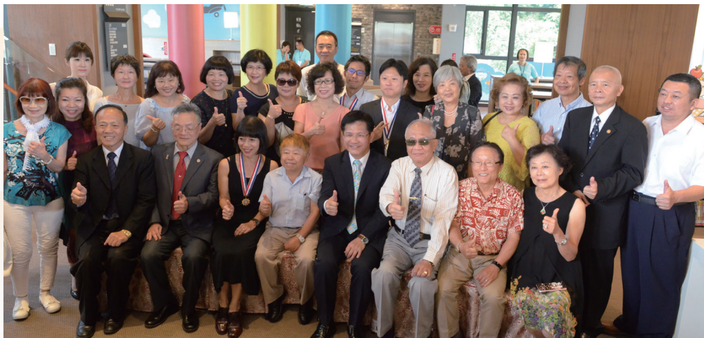
臺中市南屯區李科永紀念圖書館分館開幕合影