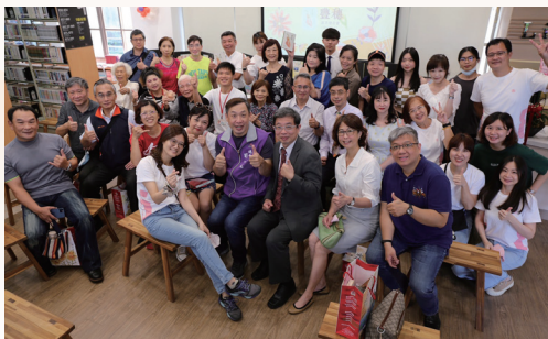
於涵碧書屋辦理「豐穗」新書發表會

最後，身為一名圖書館員，我深信「真正重要的東西是看不見的。」圖書館的價值不僅體現在書籍上，更重要的絕對是在書與人之間的連結，以及人與人之間的情感聯繫。我期勉自己永遠要做圖書館裡的太陽，努力打造一個充滿溫暖和關懷的第三場域。謝謝每一位支持我的朋友，這份榮耀歸屬於每一位夥伴和讀者。謝謝大家！