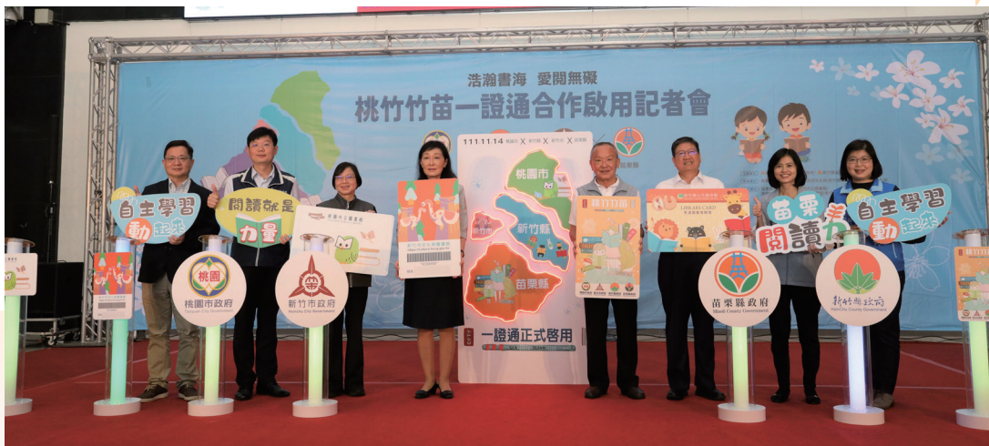
桃竹竹苗一證通記者會

本人獲頒第二屆教育部圖書館事業貢獻獎，是對新竹縣長期推動閱讀努力的最大肯定，一方面我要感謝縣府團隊的努力付出，另一方面要感謝縣民朋友對閱讀的重視與支持。新竹縣是全國最年輕的縣市，平均年齡40.25歲；另外，幼年人口（0-14歲）比率約16%，亦是全國第二高的縣市。我很喜歡閱讀，深知閱讀能力是所有學習的基礎，更有助開拓孩子們的視野。因此，我擔任縣長以來，透過串連各局處活動，結合企業資源，推動閱讀向下扎根，把閱讀的影響力由點、線、面不斷延伸，也藉此拉近城鄉學習資源的差距。另外，我也大力支持寬列圖書館營運預算，挹注各鄉鎮市立圖書館圖書購置及閱讀環境優化，並秉持團結合作力量大的精神，擴大與其他縣市及大學圖書館借閱合作，並興建總圖書館，致力推廣全民閱讀風氣。我們的信念是「沒有最好，只有更好！」我和縣府團隊將以此為基礎，大步邁向下一個里程碑。