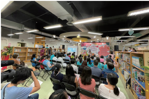
萌寶貝閱讀當家記者會

感謝一路以來，在圖書館事業中前輩們之指導與提攜，讓新竹縣全縣公共圖書館逐步成長，期盼我們所推的閱讀環境與資源能持續成長茁壯。