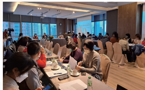
新竹縣公共圖書館發展委員會