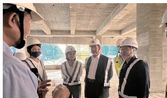
視察新竹縣立總圖書館工程