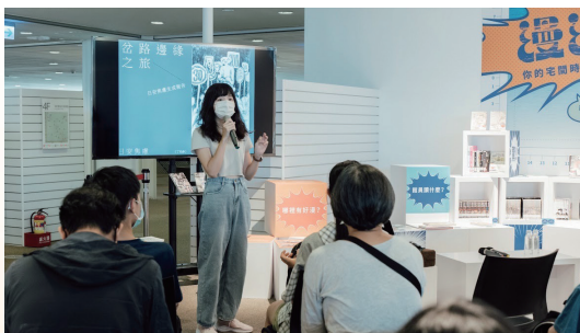
主題特展 - 《漫潮聚落》

閱讀不再受限於紙本，高市圖致力打造有趣多元的閱讀體驗環境，並在新世代的多元科技閱讀概念下，透過中央前瞻計畫經費的支持，將「AR科技」與「繪本創意」完美結合，透過遊戲的互動引導，更能潛移默化地傳達生活教育理念。同時，亦結合「生生用平板」的政策，透過與教育局、學校的溝通與共同規劃，高市圖攜手校園打造沉浸式閱讀元宇宙，帶動學童體會數位閱讀的樂趣。