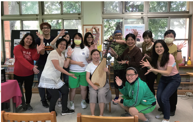
辦理創意多元主題書展，圖為音樂書展系列活動之一

對於工作的熱情，不僅限於圖書館業務的投入，更著眼於推廣閱讀和激發學生創作熱情。為給予學生舞臺，精心挑選亭中學生文學作品25篇，製作成國際通用的ePub電子書，在國內最大的中文電子書平臺「讀墨」與全球通行的Google Books、Apple Books電子書平臺上架，讓這些優秀的學生創作能夠在全世界流通，激勵學生除了閱讀，更要勇於創作。