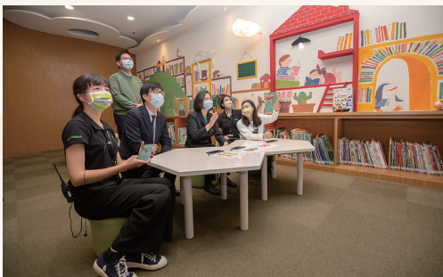
蔡英文總統視察參觀體驗

期待繼續以館員職涯作為創作實踐，讓國際繪本中心的16萬冊豐富繪本可以走進更多人的生命，也將持續灌溉「好繪芽繪本創作人才扶植計畫」，讓孩子們看見更多原創好故事。身為館員，更相信閱讀能「創作」出精采生命，期待能為讀者打造閱讀的多重宇宙，從圖書館出發，為世界帶來多元化的未來及文化。