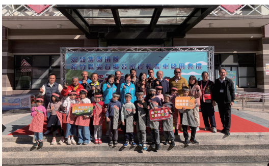
媒合企業推動尖石鄉行動書車

110年推出新竹縣國中小學校圖書館及公共圖書館通用樂讀卡，提供本縣學童一張暢行學校及公共圖書館的借閱證，便利學童取用閱讀資源，另可同時享用學校及公圖所擁有的電子書資源，家長更可透過School+ APP關心孩子的借書紀錄；並攜手大新竹地區學術型大學圖書館合作，自110年3月起與清華大學、明新科技大學及陽明交通大學新竹分校圖書館啟動互換借閱證服務，讓縣民可汲取廣博的學術知識、學子亦能利用公共圖書館館藏獲取生活的養分，共享互通更豐富多元的館藏資源及服務據