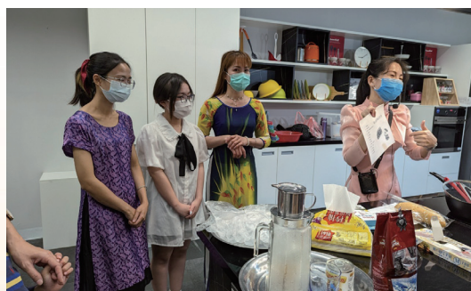
新住民烹飪課認識東南亞飲食文化