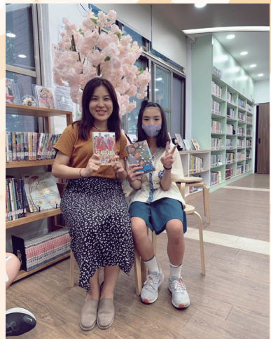
與學生分享薦讀好書的日常