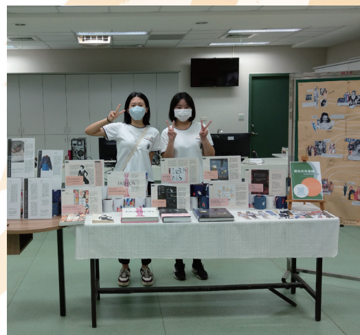
書展「妳揮揮衣袖，留下所有雲彩」

緣起於Covid-19疫情停止實體上課，圖書館因應推出精選說書影片及自製文本書摘，帶領導讀並設計問題展開分組討論，邀請同學共同在家閱讀防疫。由於學生迴響熱烈，暑假活動結束後延續改於週末辦理，並由學生輪流擔任設計者與主持人，亦有很多同學畢業成為校友後持續參與，漸漸形成混齡正向聊書的支持社群。至今活動時數累計超過100小時。