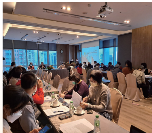
新竹縣公共圖書館發展委員會