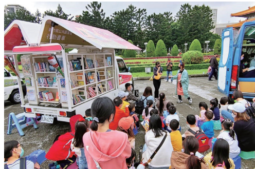
行動書車積極參加臺灣閱讀節活動