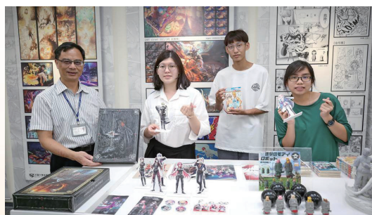
靜宜大學透過雙聯展呈現動漫產業的軟實力與創意成果