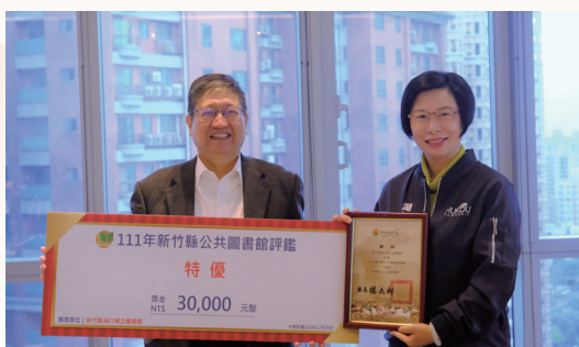
公共圖書館發展委員會表揚績優館舍