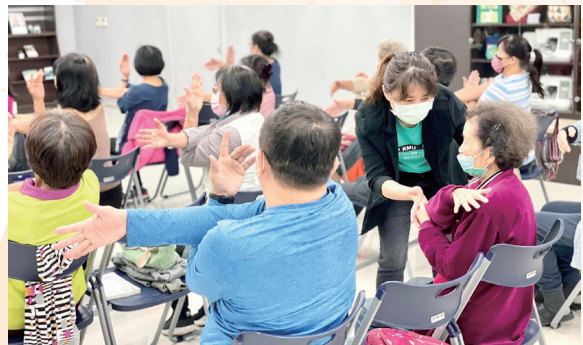
小港醫院專業師資帶領長者進行銀髮族運動