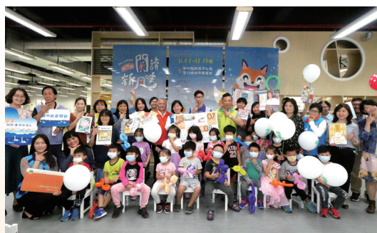
串聯全縣公共圖書館共推閱讀