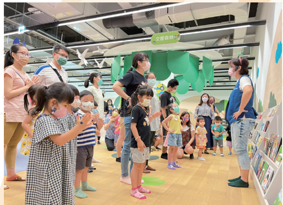
五感探索區推動嬰幼兒早期閱讀素養