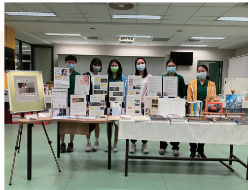
書展「人生很難，還好有電影」策展人座談