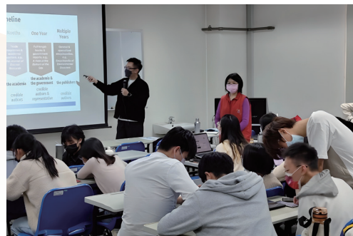
入系協助教授整學期 EMI 課程