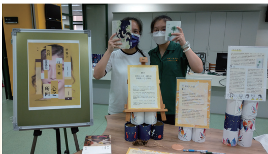
書展「世界上只有一種性向，那就是心之所向」