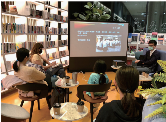
於文學沙龍辦理真人圖書館活動

繼臺北市立圖書館、新北市立圖書館後，全臺第三個通過ISO 9001驗證的公共圖書館，透過明確的標準作業流程，提供讀者穩定一致的服務品質。