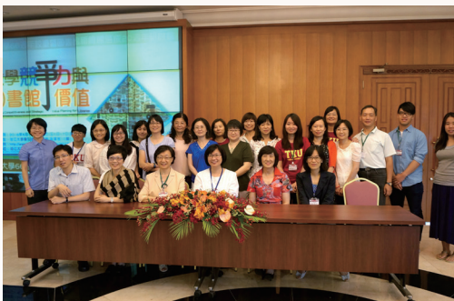
總館 20 週年館慶研討會

這些成果都是團隊合作的結晶，也是我們不斷學習與成長的見證。我們深信圖書館不只是一個空間或一個系統，而是一個有生命、有溫度、有價值的組織。我們將繼續秉持「貼心、知心、精進」的品質政策，從使用者角度出發，創造更多符合時代需求的服務與活動，讓淡江大學圖書館成為學術研究、教育創新、社會參與的重要夥伴。謝謝大家！