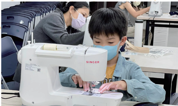
小小讀者化身裁縫師，初次上機體驗縫紉機

長者步入老年後對於孫子、孫女的關注，係其生活的一大重心，本館推動「樂閱讀樂手作－祖孫的療癒時光」、「代間共親職講座－隔代不隔愛，做最棒的阿公阿嬤！」等活動，促進青銀共學、老幼共讀。除了為長者規劃的活動外，也積極推動全齡閱讀，啟動「英語列車」行動書車前往高雄各區學校，擴充學校英語書籍資源及建立青少年英語閱讀風氣，並與社區單位合作辦理「前草踎共－職人講堂」系列活動，廣邀社區職人，挖掘在地社區故事，亦配合總館東南亞行動書車至新住民、移工聚集的場域辦理多元文化圖書資源推廣活動，透過多種類型的活動串接不同的興趣族群，增進與落實文化平權，創造圖書館成為社區的第三生活中心。