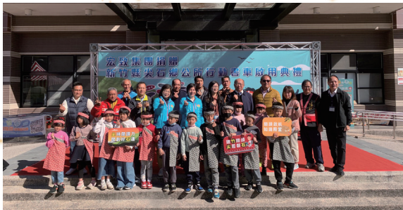
媒合企業推動尖石鄉行動書車

與竹縣教育局合作推動共讀書箱，並與國小閱推教師合作推廣閱讀，110年起開創樂讀卡服務，提供全縣國小學童陪著孩子長大的借閱證，便利享用學校及公共圖書館資源，積極推動校園閱讀服務，獲教育部頒發閱讀磐石獎。於館際合作方面，推動縣內清華大學、陽明交通大學及明新科技大學互換借閱證服務，促進學術與公共圖書館交流，擴大服務場域及讀者族群；109年起攜手新竹市、臺北市、桃園市及苗栗縣，112年接洽新北市，逐步啟動北北桃竹竹苗一證通服務，另有國資圖一證通；除互通借閱證、共享服務據點及館藏資源，更能有效促進電子資源互通。此外，持續爭取企業贊助，贈送行動書車進入偏鄉及校園閱讀推廣，鏈結基金會及醫院串連辦理閱讀節及嬰幼兒閱讀推廣系列活動，積極跨界創新服務，致力打造愛閱竹縣。