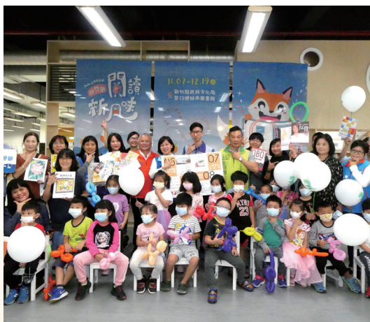
串聯全縣公共圖書館共推閱讀

積極爭取設置本縣公共圖書館事業發展委員會，重新確立新竹縣公共圖書館流通政策，提升每人借閱冊數、開啟通閱服務及新書政策，有效促進圖書流通；逐步更新與汰換資訊設備與自動化系統，並積極爭取以短中長期計畫逐步完成全縣RFID智慧化設備導入圖書館流通服務，建置公共圖書館入口網、APP及LINE服務，並爭取提升電子資源預算編列及購置多元適性之電子資源，用心提供讀者優質服務。