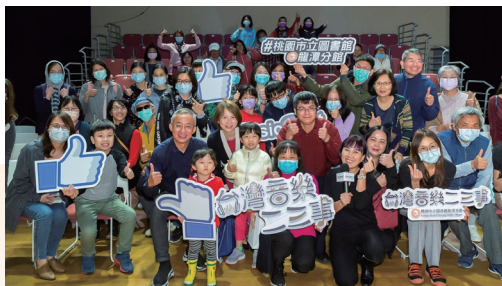
臺灣音樂二三事活動

為連結在地音樂特色，龍潭分館設有臺灣音樂紀念館，設計主軸以臺灣歌謠之父鄧雨賢為主要意象，典藏臺灣音樂及地方特色館藏，利用數位互動的方式導覽音樂故事，同時結合時代故事場景與AR技術之運用，使民眾透過音樂體現時光的流轉，徜徉於每一段音樂故事。每年持續舉辦互動特展及音樂品牌活動，啟發民眾對音樂藝術覺察與熱情，提升在地讀者的音樂素養，成為具在地特色且富含藝術文化的複合式圖書館。