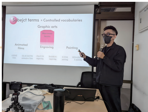
創產所跨領域入課擔任客座講師演講

任職於醫分館期間協助主管綜理參考服務業務，擔任110年度公務人員錄取人員實務訓練輔導員，除參加輔導講習測驗得滿分，另因輔導績效良好，各獲嘉獎一次；任職成功大學總圖書館秘書一職期間襄助館長、綜整全館業務。擔任館內外單位聯繫窗口、參與空間改造工作小組及館長聯席會籌劃，完整強化公務行政歷練。肩負全英語學習環境推手、卓越教學者及研究者、虛擬導覽館員、客座講師、網頁設計師及綜理館務之秘書等多元角色，多重任務與能力集結一身，為成功大學圖書館及圖資界奉獻心力。