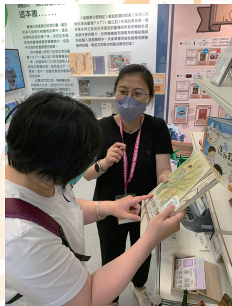
介紹本館本土語言（客語）之特殊資料

透過各機關及出版社間的合作，爭取資源挹注，並積極促進身心障礙服務轉製服務，結合跨界專業資源，聯合行銷，擴大服務倡議宗旨。辦理多項推廣活動，包含：特殊格式圖書資源主題書展、易起來圖書館－圖書館利用服務暨閱讀推廣活動、臺灣母語日手語說故事活動、生態永續海洋篇－《珊瑚很有事》觸覺閱讀書展、協助製作《防災小晴靈》雙視圖書、巧連智月刊特殊圖書資源製作，以及與國立臺北教育大學特殊教育學系及國立臺灣師範大學特殊教育學系簽署推動特殊圖書資源應用等。