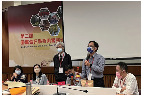
第二屆圖書資訊學術與實務研討會