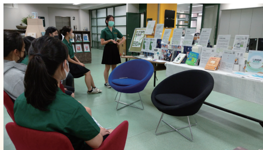
書展「在大減絕來臨前」策展人座談