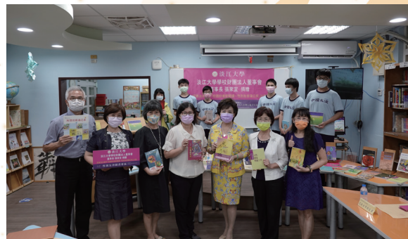
性別友善蒲公英贈書活動