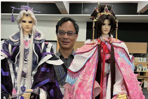
「霹靂英雄戰場」靜宜大學特展

112年10月是我在靜宜大學蓋夏圖書館任職滿30周年，不忘初衷，秉持「知新、求新、創新」的態度，懷抱熱忱與服務的動力，視圖書館為個人志業在經營。面談時有委員提問，我在圖書館30年，最大的貢獻是什麼？當下沒有回答得很完整，我想相關的貢獻包含帶領蓋夏圖書館進行數位化，建立電子資源管理系統，在圖書館界產官學界建立良好的人脈關係，並打響蓋夏圖書館在策展行銷上的品牌形象等。今年很榮幸能夠獲得第二屆教育部圖書館事業貢獻獎一傑出圖書館主管獎，成為自己在圖書館界職涯里程碑，也感謝自己對圖書館事業的努力。