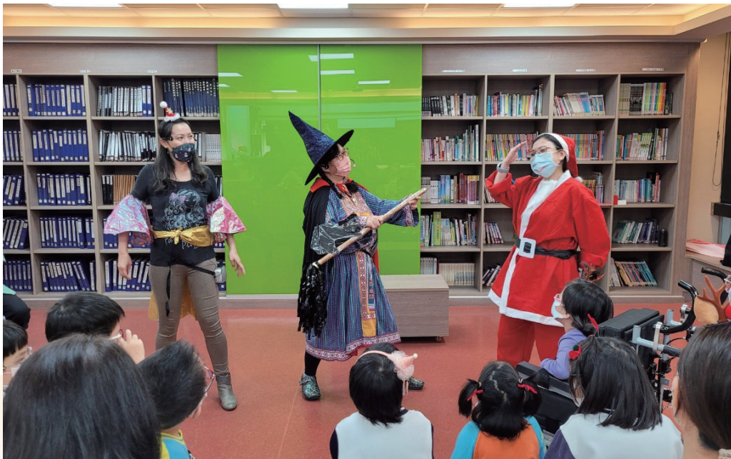
啟明聖誕節說故事劇場

每一個計劃的完成，要感謝所有一起工作的同事及長官、一路相互扶持的特教學校與老師、無條件支持的合作單位夥伴以及那一雙雙沿途中支援、鼓勵的雙手。是大家合力揚起風帆，載著愛與信任，向前航行。如果這段旅程是為了有所實現，我想是《成為一顆樹》、變成《花婆婆》或僅僅是《好好照顧我的花》，成為一棵足以提供社會養分的樹、為荒蕪處撒下種子、停下來灌溉小花草，靜靜的呵護與等待。如果可以許願，盼望臺灣的出版市場再次繁花盛開，讓芝蘭之香能夠回應身心障礙者汲取知識的渴望。