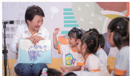
為孩子朗讀繪本，小朋友們開心聽故事