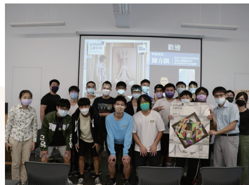
臺灣國際人權影展 X 新竹高中 映後座談合影