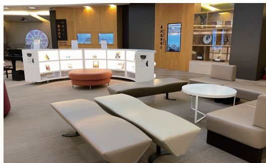
總館 1 樓大廳