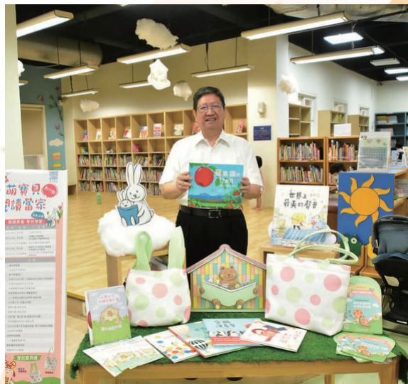
嬰幼兒閱讀推廣活動

為擴大資源共享及便利民眾取用資源，於109年圖書館事業發展委員會，力推啟動全縣通閱服務，提升圖書流通效能並促進資源共享，並為擴大資源共享圈，自109年至112年持續推廣一證通，包含：新竹市、桃園市、臺北市及苗栗縣，並啟動國立公共資訊圖書館一證通服務，提供愛書人僅須持有新竹縣借閱證，即可共享2,500萬冊館藏及線上電子資源。