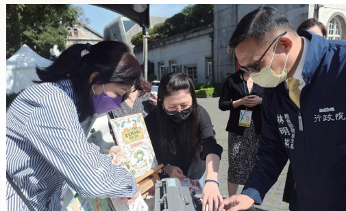
展示本館特殊資料