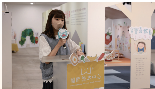
主題特展 - 《寶寶喜歡看》