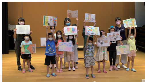
畫我心目中的圖書館繪畫活動