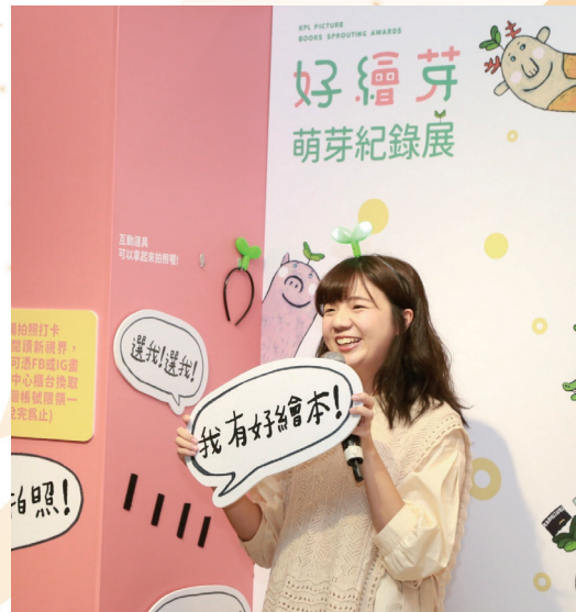
好繪芽－繪本人才扶植計畫

服務著0至99歲全齡讀者，國際繪本中心27種語言、43個國家，16萬本多元豐富館藏，舉辦線上、線下閱讀講座及多樣閱讀推廣活動，年逾250多場次，並積極與出版社和文教基金會等單位合作，散布城市閱讀種子。公共圖書館為市民資源與學習中心，書是可以給人無限想像的自由世界，而圖書館就是可以讓人安心沉浸在這世界的場域，透過圖書與藝術、教育等專業的結合，打造讀者閱讀的多重宇宙，同時帶來多元而開拓的文化體驗。