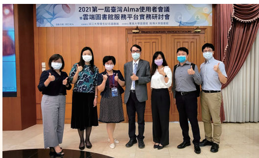
第 1 屆臺灣 Alma 使用者會議

淡江大學與婦女新知基金會合作，協助轉移婦女運動歷史資料，將其數位化建置內容保存於圖書館，成為淡江一大特色。有感於臺灣推動婦權與性別平等的漫漫長路上，淡江人扮演開拓和倡導的角色，為了回顧淡江人對臺灣性平與婦運發展的影響，並彰顯淡江落實聯合國永續發展目標「SDG5性別平等」的重要貢獻，策劃「性平路上的開拓者：婦運先驅在淡江暨吳嘉麗教授紀念展」，聚焦淡江人投身於「婦運」與「性別平等」發展的歷程事件，回顧淡江性平發展來時路。為延伸展覽成效，分別與學校董事、校長及女書店等共同合作，推動校園性平教育扎根，陸續捐贈性平教育書籍至新北、桃園、臺中、彰化及高雄等地區中小學，彰顯圖書館主題策展的外溢效益，發揮大學的影響力。