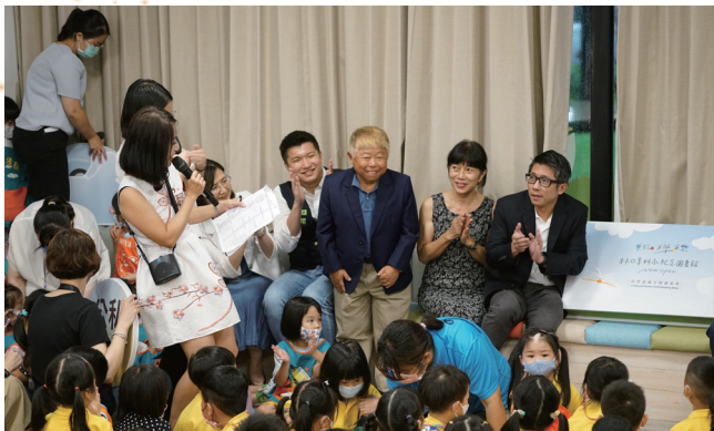
林口區李科永紀念圖書館開館儀式

第八、九、及第十座李科永紀念圖書館，目前已經完成桃園、竹南二館及臺南簽約及部分捐款，但各地進度不同，故開館順序未來將依實際落成時間調整。桃園市李科永紀念圖書館相關細節刻正規劃中；竹南二館將於大厝里活動中心旁興建新的親子圖書館；臺南市李科永紀念圖書館選址於安南區草湖寮公園，更邀請日本建築大師伊東豐雄親自操刀設計。