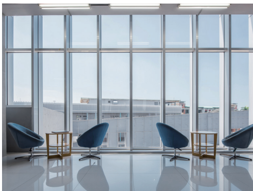
3F 閱覽區 - 玻璃帷幕邊以自然光景伴隨閱讀

草衙分館於高雄市一區一圖閱讀藍圖擘劃下，於103年9月28日開幕啟用。基於地緣與社區背景，以勞工、多元文化為館藏特色，並開展與社區的多樣互動。109年起串聯高雄市立小港醫院及育英醫護管理專科學校，共同簽訂合作備忘錄，串聯文化、醫療及教育，為社區居民就近提供在地樂活資源，以圖書館為主體，邀請也伴隨長者於老化過程中，有著老幼共學、青銀相伴的終身學習第三人生。