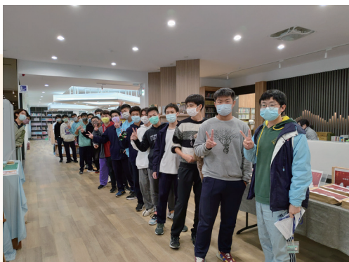
驚喜書袋過好年活動

位於竹中後花園，緊鄰十八尖山，一旁是辛園，是一座被大樹圍繞的「森林圖書館」。早在民國39年校園平面圖上註記「圖書館預定地」，但要再廿多年後，直到62年，辛志平校長退休前向校友與師生勸募，同時帶領在校生利用勞動服務課程協助整地，這棟集眾人之力興建的圖書館於63年6月1日落成，為三層樓獨立館舍，總面積1,977.34平方公尺，是辛校長在竹中卅年完成的最後一棟建築。歷經四十餘年，建築略顯老舊，也有許多亟待改善的地方。106年校友會理監事會議討論並通過「圖書館整建提案」，同時建議整建後命名為「辛志平校長紀念圖書館」，在以校友會募款為主和國教署計畫經費配合下，共有428位校友捐款，200多位在校生參與人龍傳書，再現當年校友師生齊心出錢、出力、共同興建的方式，完成圖書館的整建翻新。辛志平校長紀念圖書館於110年11月3日重新啟用，為舊建築賦予新生命，提供竹中師生一個更好的學習環境，延續竹中精神，也作為111年竹中建校百週年最佳的獻禮。