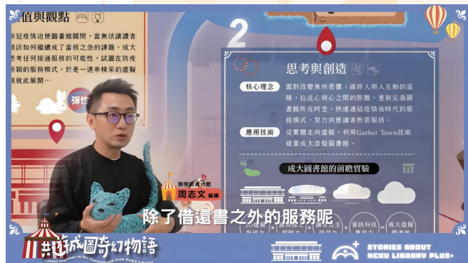
參加 110 年中華民國圖書館學會海報展規劃設計及影片解說