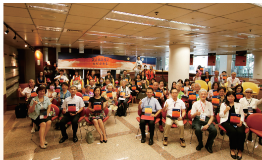
淡水福爾摩莎國際詩歌節開幕式