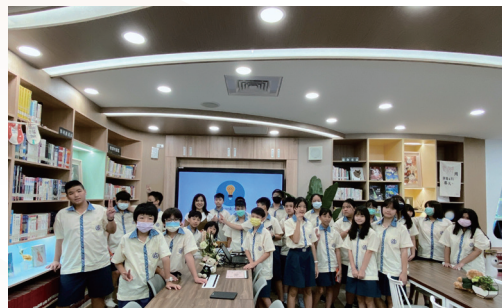
帶領新生圖書館利用教育課程