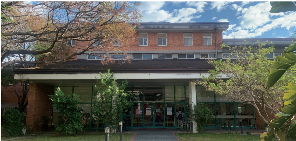
新竹縣政府文化局圖書館

前身為日治時代新竹州圖書館、新竹縣立圖書館，民國85年隨新竹縣立文化中心落成啟用而遷移至現址。現有館藏約38萬冊，以「建築藝術」、「客家」資料及新竹地方文獻為特藏，整體建築古色古香，提供人口快速成長的竹北市，一處閱讀、休憩及親子共享的基地。近年因規劃總分館體系營運，新竹縣政府文化局帶領全縣13鄉鎮市圖書館，積極整合全縣資源及推動創新服務模式，持續活化圖書館閱讀動能，設計多元化、跨族群之主題活動，提供不分性別、年齡、種族、社經地位及地區的讀者所需資源，成功打造公共圖書館品牌，致力推廣悅讀新風貌。