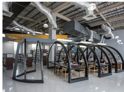
3F 閱覽區 - 搭乘船座啟航深度閱讀