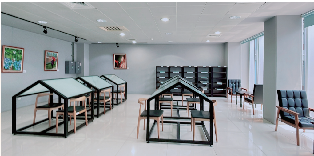
2F 閱報室 - 牆上的樂齡志工畫作增添整體空間氛圍