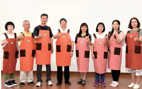
推動全縣公共圖書館制服換新